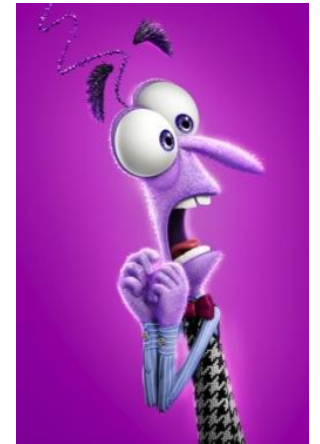
Inside Out (2015), Pixar Animation Studios