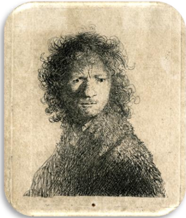
Rembrandt, Zelfportret , 1630.