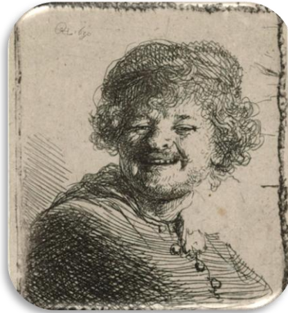
Rembrandt, Zelfportret , 1630.