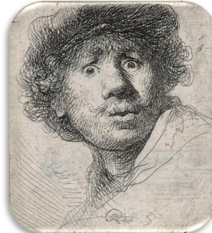
Rembrandt, Zelfportret , 1630.