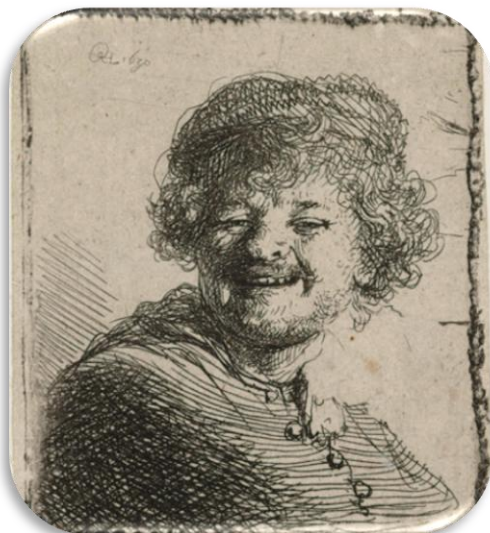
Rembrandt van Rijn, Zelfportret , 1630.