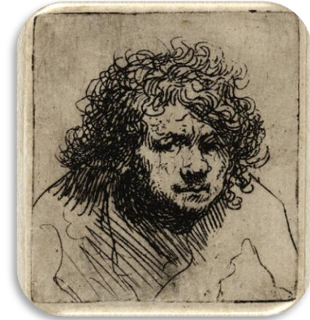
Rembrandt, Zelfportret , 1628.