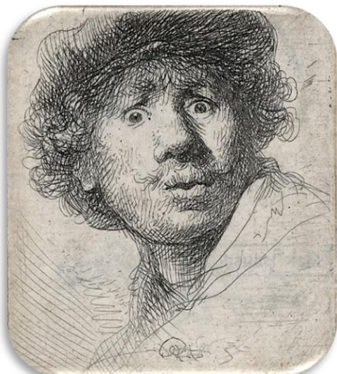
Rembrandt van Rijn, Zelfportret , 1630.